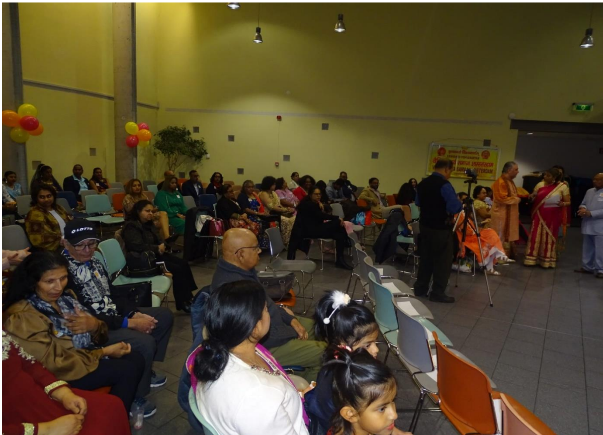
Aanwezig publiek 35-jarig bestaan.

Ter gelegenheid van dit 35-jarig bestaan is een brochure uitgegeven.