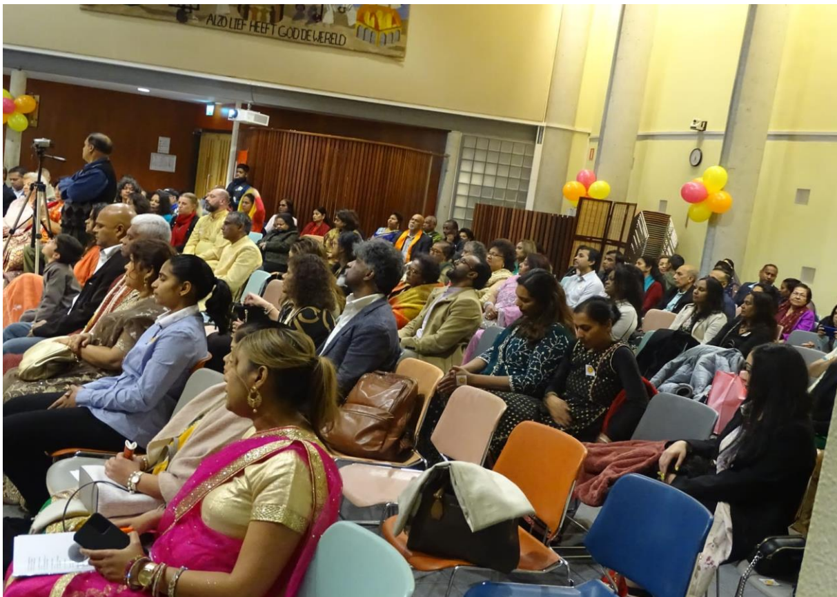
Publiek bij de jubileumviering

VAS-Amsterdam heeft een ANBI-status sinds 2008. In 2022 heeft VAS-Amsterdam de ANBI-status weten te behouden, hierdoor blijven giften in natura en in geld aan VAS-Amsterdam nog steeds fiscaal aftrekbaar zonder het geldende drempelbedrag te hoeven toe te passen. Het bestuur zal ernaar streven de ANBI-status ook in de komende jaren te behouden.